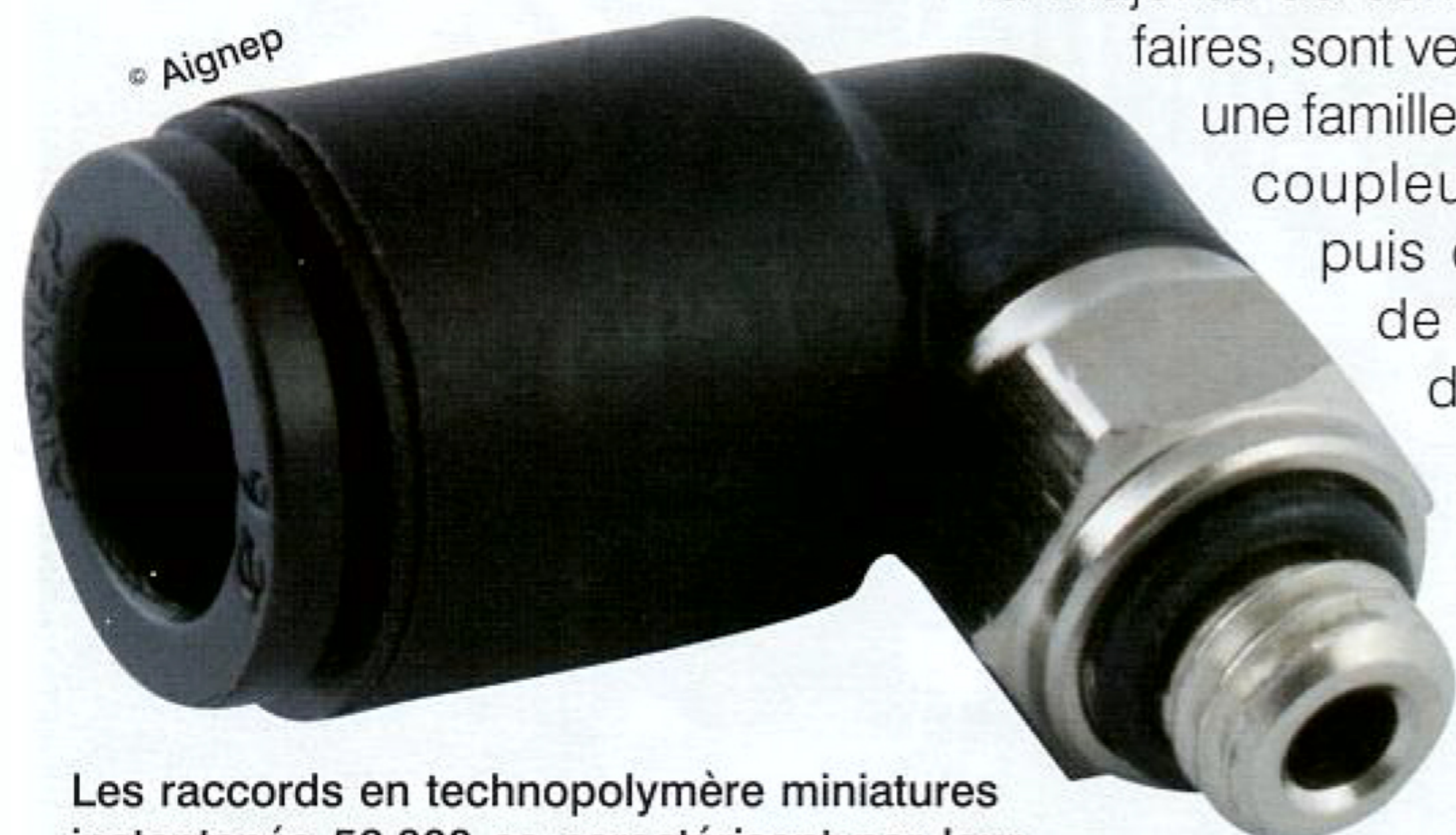
Les raccords en technopolymère miniatures instantanés 56.000 se caractérisent par leur extrême compacité et leur poids allégé.

Une zone spécifique de l'usine est dévolue aux raccords et vérins inox, destinés à des marchés tels que l'agroalimentaire, la chimie ou le médical. Le parc machines consacré à ce type de fabrication a doublé en l'espace de cinq ans du fait d'un fort accroissement des débouchés