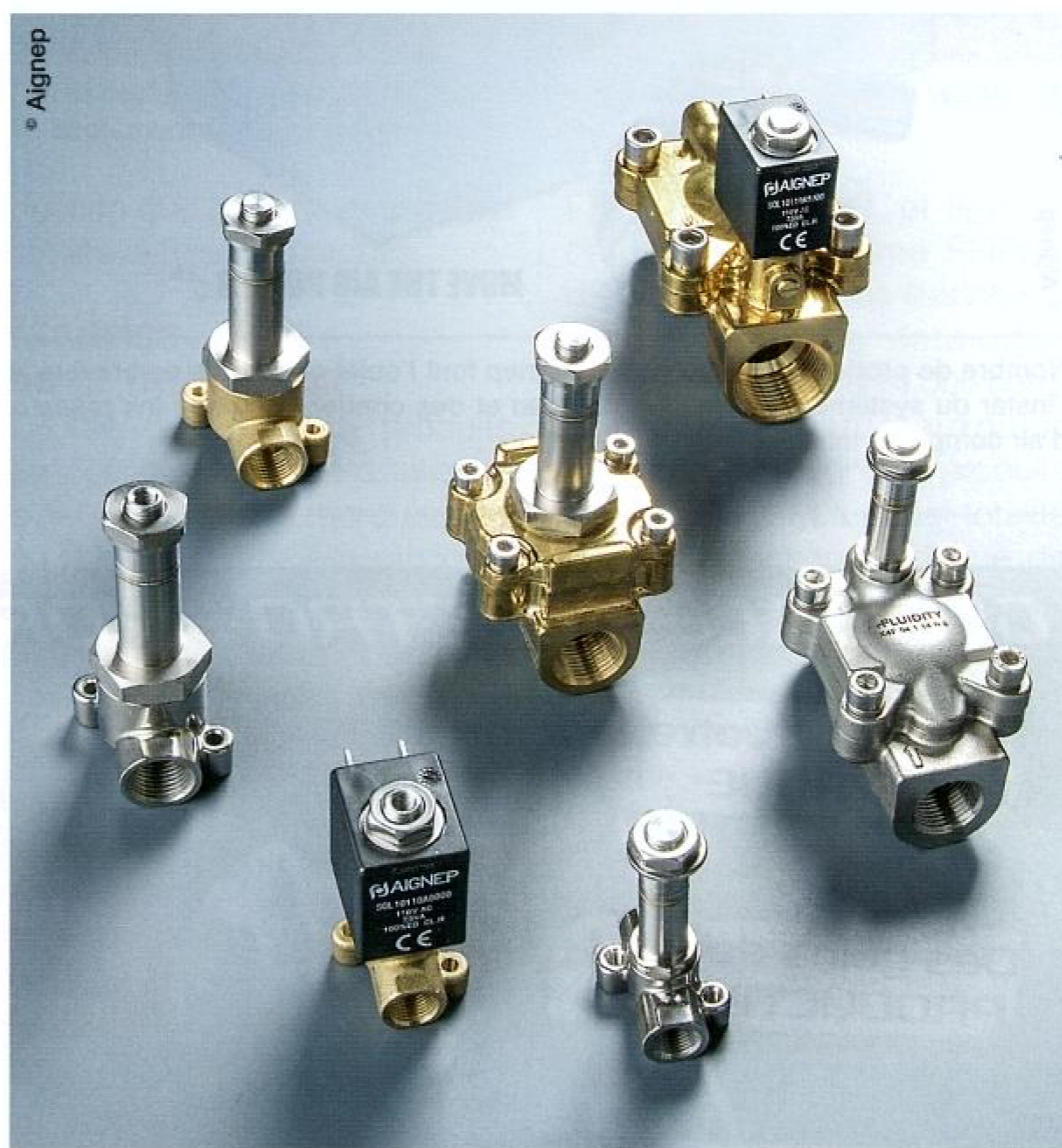
Une nouvelle ligne de produits – les électrovannes Fluidity – est venue récemment renforcer le catalogue de l'entreprise.