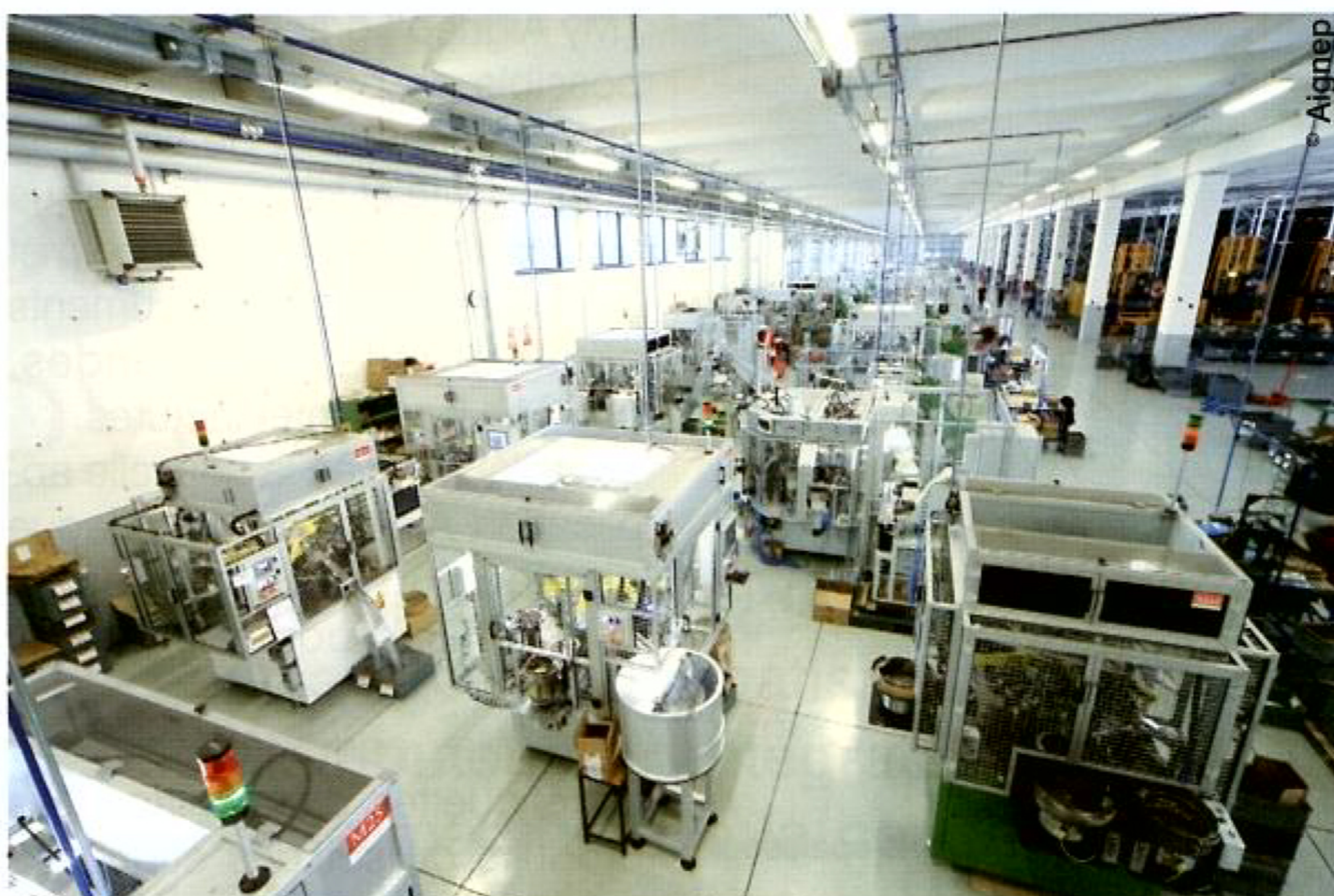
Toute la fabrication est intégrée au sein des 22.000 m 2 couverts de l'usine italienne d'Aignep.

Dans le prolongement de l'expérience accumulée par Aignep dans le domaine des raccords et de l'automatisation, une nouvelle ligne de produits – les électrovannes Fluidity – est, en effet, venue récemment renforcer le catalogue de l'entreprise. A