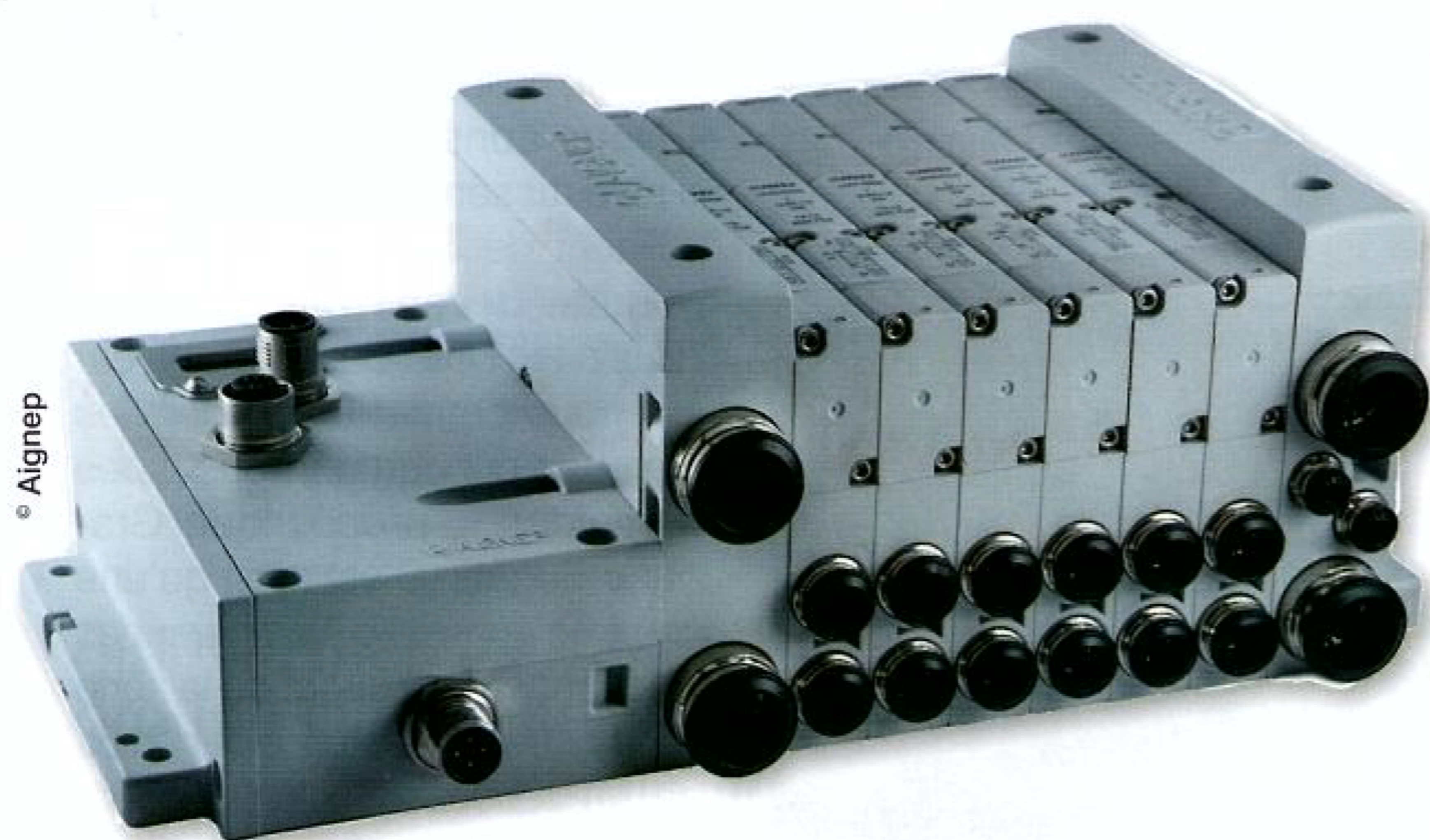
L'îlot de distribution pneumatique 15V se caractérise par une très faible épaisseur (15 mm) pour un débit allant jusqu'à 800 NI/min.

La journée de célébration des 40 ans d'existence d'Aignep a également donné à son directeur général l'occasion de dévoiler la toute nouvelle série d'îlots de distribution pneumatique 15V. Doté d'un corps en aluminium laqué, d'un corps de distributeur en technopolymère renforcé, d'un tiroir en aluminium nickelé et d'un ressort en acier inoxydable AISI 302, cet îlot se caractérise par une très faible épaisseur (15 mm) pour un débit allant jusqu'à 800 NI/min. Il se distingue aussi par une grande facilité de montage, une configuration flexible et modulaire allant jusqu'à l'assemblage simultané de 32 valves, ainsi que par un remplacement aisé, le cas échéant. Il est doté d'une connexion Profibus, d'autres protocoles (Ethernet IP, Profinet, DeviceNet, CC-link...) devant être disponibles dans un avenir proche.